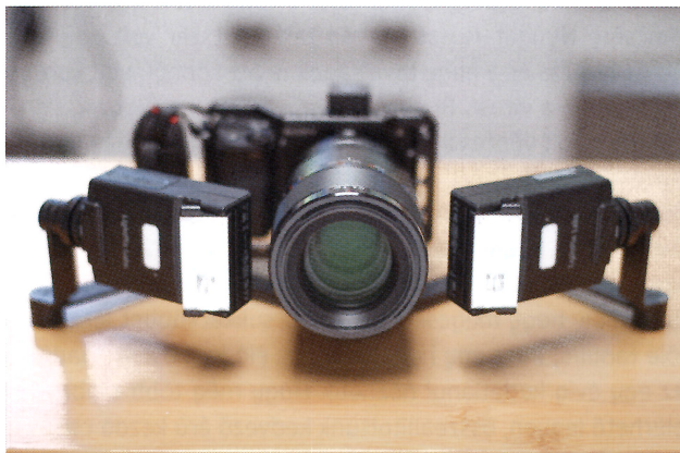
Sony a6400 + Sony 90 mm macro lencse + FlashQ vakuk

Jelenleg 90%-ban még egy hagyományos, digitális tükörreflexes géppel fotózom, ez egy Nikon D610-es kamera, ami lassan 9 éves lesz. Még mindig kiváló a képminősége, de az újabb tükör nélküli (MILC) kamerák sok kényelmi funkciót nyújtanak és jóval megfelelőbbek, ha valaki videózni is szeretne. Ezért vettem egy Sony Alpha A6400-as kamerát, ami videóban sokkal jobb, de a Nikonnak még mindig nagyságrenddel jobb a képminősége, pedig a felbontás azonos. Ebből is látszik, hogy az újabb nem mindig jobb!