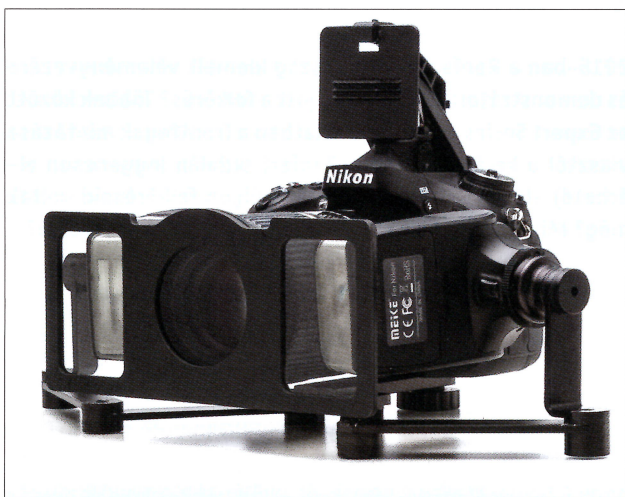
Nikon D610 + Tamron 90 mm macro lencse + PolarFrame

Ha valaki lupét használ, akkor annak mindenképpen tükör nélküli fényképezőgépet ajánlok, mert a fókuszáláshoz egyenértékűen lehet használni az LCD kijelzőt és nem kell levenni a lupét és belenézni a keresőbe. Ez hatalmas előnyök az új gépeknek!