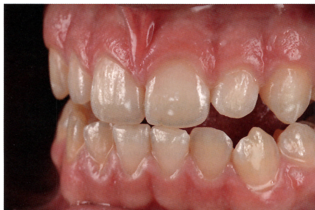
Fiatal fogak lágy fényel.

Az egyik egy keresztpolarizációs szűrő, ami segít a fogszín elemzésben. Ez abban különleges, hogy konzolos ikervakuk használata esetén is reflexiómentes képet biztosít. Én szinte a kezdetektől fogva ikervakukkal fotózom és azok egy speciális konzolon vannak, ezért egy olyan eszközt dolgoztam ki, aminél mindegy, hogy a vakuk milyen szögben állnak, a képen nem lesz visszacsillanás a vakuktól. A szűrő mágnessel kapcsolódik a lencse elején lévő adapterhez, ezért nagyon gyorsan lehet felrakni és eltávolítani. Egy tipp a becsillanásra: fényes felszínű szájtérpeszek is okozhatnak csillanást a fogakon még keresztpolarizációs szűrő esetén is, ezért én 50 µm alumínium-oxiddal matra fújtam a szájtérpeszek külső felületét és ezzel elkerülhető az extra csillanás. A másik egy tárgyfotós készlet, fénylágýítókka és állványokkal. A fejlesztés idején sokat utaztam előadásokra és kellett egy olyan készlet, ami nem foglal sok helyet, ezért olyan anyagot kerestem, ami könnyű, vékony, megfelelő a fényáteresztő képessége és garantált a vastagsága. Taiwanon találtam egy céget, akik LED-es lámpákhoz gyártanak fénylágýítókat és tőlük tudtam beszerezni az alapanyagot. Az oldalamon bőven találni információkat az eszközökről: www.hantdental.com/dp