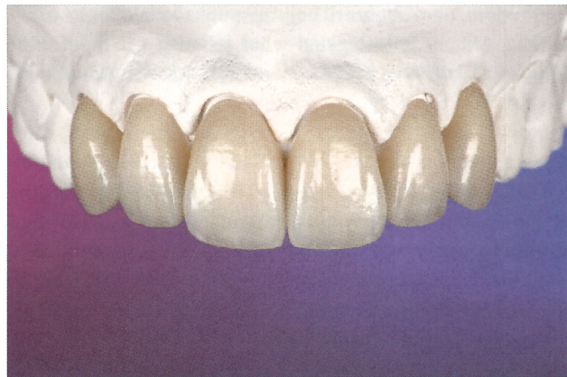
IPS e.max restauráció.

Az én kiegészítőim főleg továbbgondolt verziók és a mi igényeinknek megfelelően módosított eszközök, nincs bennük eget rengető újdonság, csak könnyebb a használatuk.