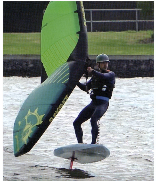
Csak víz és szél kell, de havon és szárazföldön is használják.

Szeretem a vízi sportokat és jelenleg a wing foilozás a fő hobbim. Nagyon jó kikapcsolódás, mert erős koncentrációt igényel, így nincs idő a fogakra gondolni. Szerencsések vagyunk, hogy a folyó és a tenger is alkalmas erre és Perth kifejezetten szeles város, így a tökéletes kombináció adott. A cápától meg nem félek.