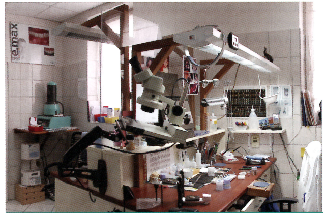
Győri labor az utolsó napokban.